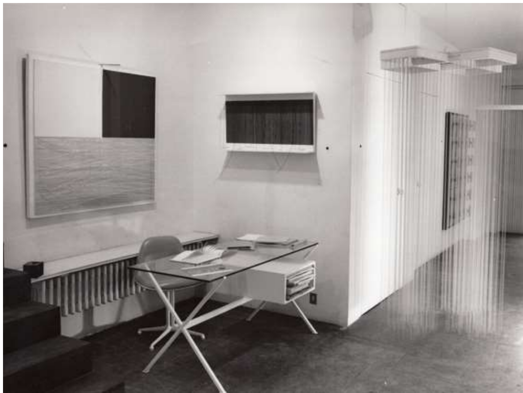
Het interieur van Galerie Françoise Mayer.